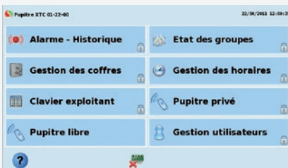
Écran multi application