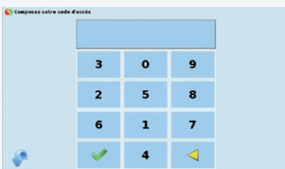
Clavier à touches aléatoires