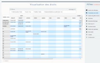
Écran des droits par lecteurs

Un simple abonnement avec l'hébergeur suffit. Son coût dépend du nombre de lecteurs, et de familles d'utilisateurs.