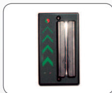
TMA01 / TMAE1